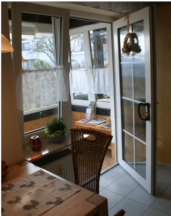
Ihre Essecke mit Wintergarten